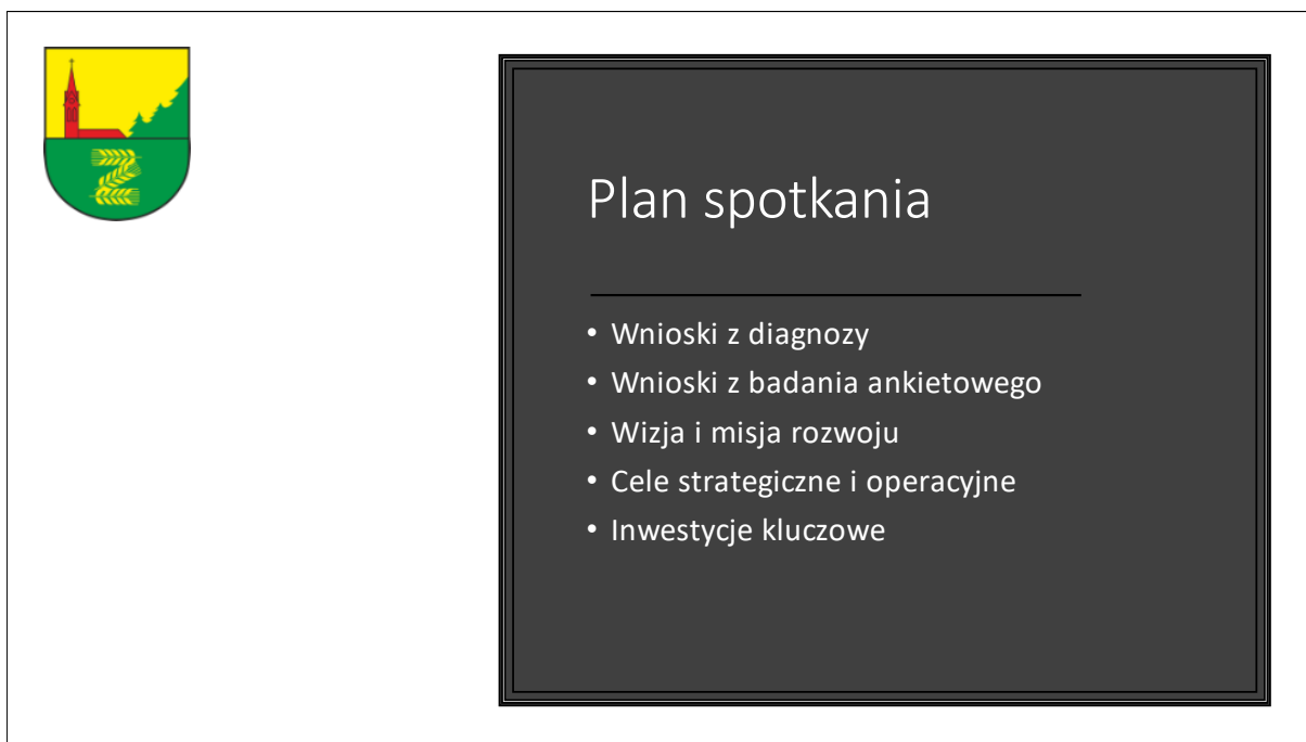
Rysunek 4. Agenda spotkań roboczych.