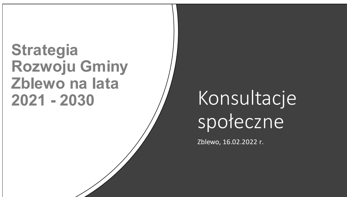
Rysunek 3. Prezentacja multimedialna – slajd powitalny