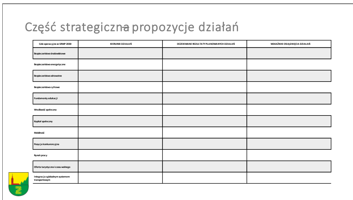
Rysunek 6. Ćwiczenia aktywizujące uczestników spotkań roboczych cz. 2.